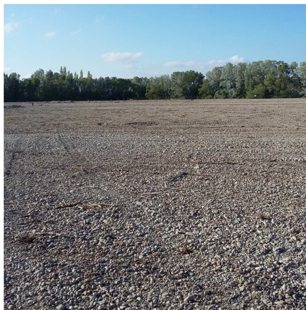
Vues en date du 11 octobre 2016 (ci-dessous et ci-contre) ↓